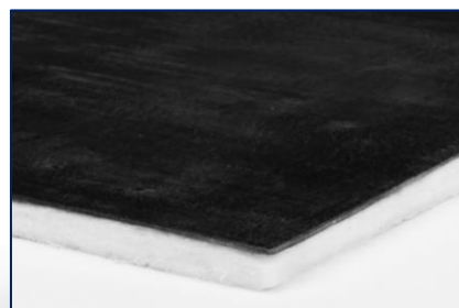
Bluedec CH met bitumen

Bluedec B.V. is gespecialiseerd in dunne isolatie- en brandwerende materialen. Naast Bluedec CH leveren wij ook andere producten op basis van aerogel, vacuüm en silica.