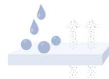
Waterafstotend & dampdoorlatend