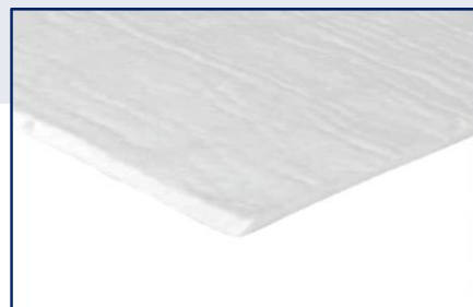
Bluedec CH ongecacheerd