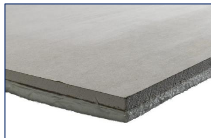
Bluedec CH met gips