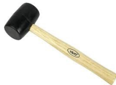
13 rubber hamer