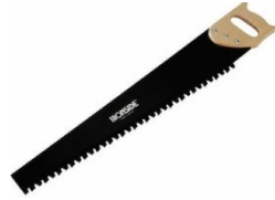
5 handzaag grove tand