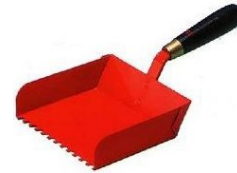
3 getande lijmbak