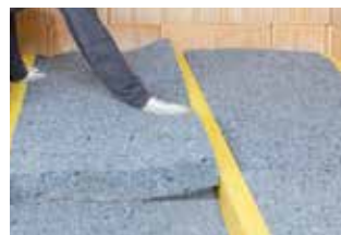
Toepassing mogelijk in dubbele en gekruiste lagen

Pavatextil P is een zacht isolatiemateriaal