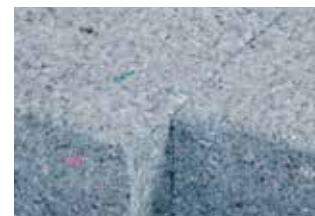
Eenvoudig en gemakkelijk te versnijden met een isolatiesnijmes