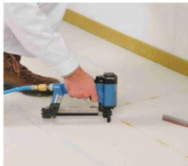
... of nieten met speciale spreidnieten, binenn 10 minuten