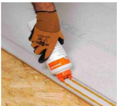
Aanbrengen van de fermacell Vloerelementen montagelijm in twee strengen op de liplas