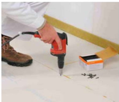
Schroeven van de liplas binnen 10 minuten ...