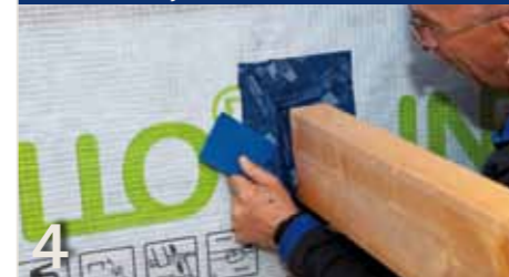
4 Vervolgens met een van de hoekkleefbanden TESCO PROFIL of TESCO PROTECT verlijmen. Klaar