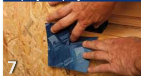
7 Afdeklag verwijderen en in het kozijnstuk verlijmen. Vervolgens rest van de afdeklag verwijderen en op het vlak verlijmen.