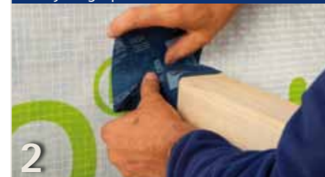
2 De nog niet verwijderde afdeklag in de hoek schuiven en op de doorvoer, bijv. balk, verlijmen.