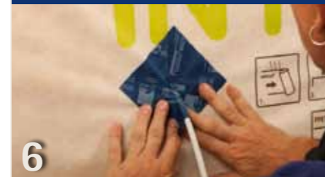
6 ... niet meer toegankelijk zijn en dus ROFLEX of KAFLEX dichtingsmanchetten aangebracht kunnen worden.