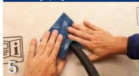
5 Eenvoudige aansluiting op lege buis of kabel tot d=40 mm met TESCO INVEX vormdeel, bijv. wanneer hun uiteinden ...