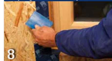
8 Tot slot kozijnstuk rondom, bijv. met TESCO VANA, verlijmen. Klaar.