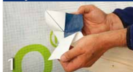
1 Afdeklag van de eerste beide benen verwijderen.