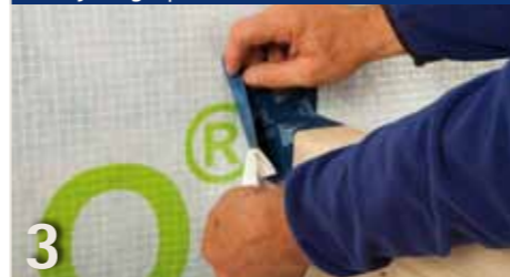
3 Rest van de afdeklag verwijderen en op het vlak verlijmen. Daarbij alles goed vastwrijven, bijv. met PRESSFIX.