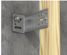
Bevestiging van de houten kepers