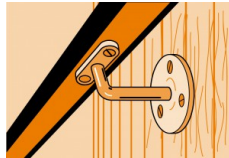
Bevestiging van leuning met gebogen ondergrond