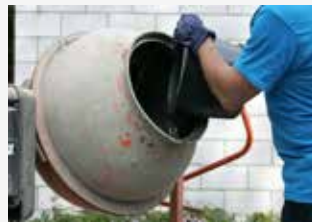
Voeg water toe.