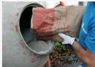
Voeg cement toe.