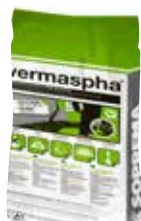
VERMASPHA los uitgestrooid