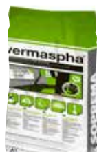
VERMASPHA los uitgestrooid