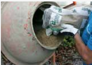
Voeg zand toe.

Mengen van het lichtgewicht beton in de betonmolen. Voorzichtig mengen is aangewezen om de samenstelling van het mengsel niet te breken. Opgelet! EFIMIX is een gebruiksklaar product: hierbij hoeft enkel water toegevoegd te worden!