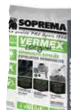
VERMEX M in warme bitumen